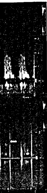
Echokardiographie der Tricuspidalklappe (Seite 2061).