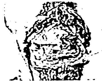
76_Thema: Strategien zur Reduktion des PCa-Risikos