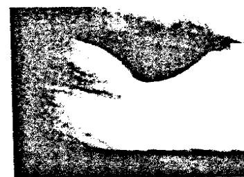
92_Abklärung des Sexualhormon-Status bei Diabetikern