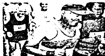
86_Auswirkung körperlicher Aktivität auf metabolisches Syndrom