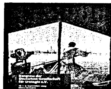
Berichte vom 61. DGU-Kongress in Dresden

100_Thema: Lässt sich mit PSA-Screening die Mortalitätsrate beim Prostatakrebs senken?