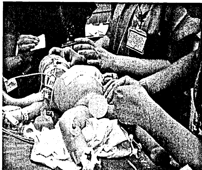
Anlage einer 18-G-Cook®-Intraossärkanüle bei einem 9 Monate jungen Knaben mit Laryngospasmus. ▶ Seite 869