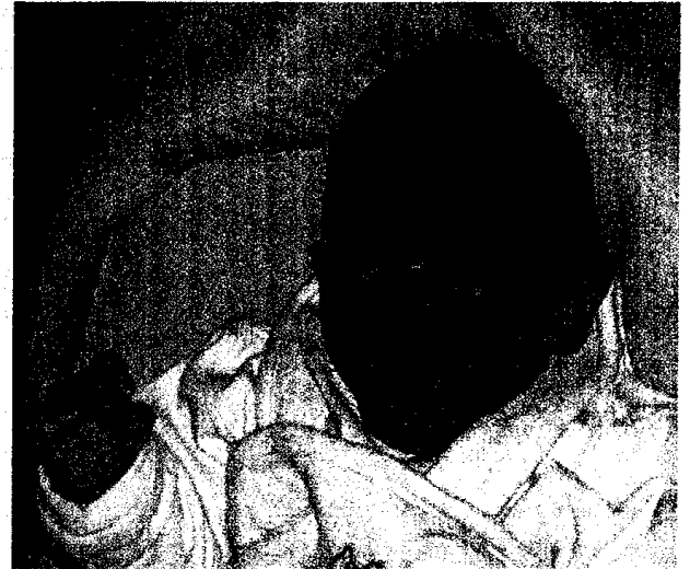
Exzessives Schreien kann Ausdruck frühkindlicher Entwicklungsstörungen sein ▶ Seite 551