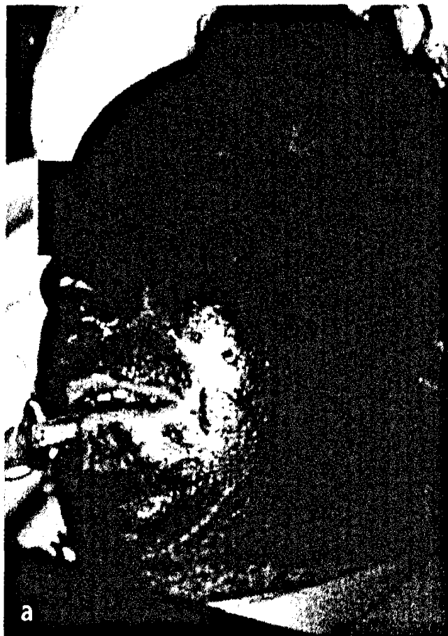
Großflächige Sugillation im Rahmen einer Pneumokokkensepsis ▶ Seite 799