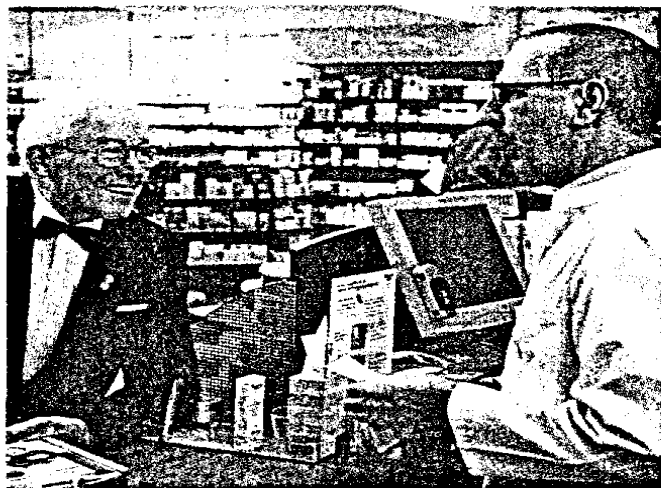
Die Gmünder Ersatzkasse (GEK) will den Apothekern mehr ökonomische verantwortung übertragen. Seite 6