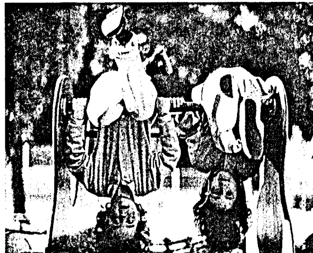
Jedes 2. Kind in Deutschland hat Erfahrung mit Schmerzen des Bewegungsapparates. ► Seite 647

Growing pains. Frequent diagnosis of unknown etiology D. Windschall · E. Jäger-Roman · M. Niewerth