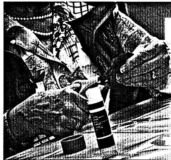
Mentale Funktionsstörungen: Extrazerebrale Ursachen und körperliche Ressourcen Seite 33