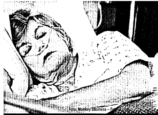
Die intermittierende Hypoxämie wirkt sich gerade bei älteren Menschen sehr ungünstig auf die Hirnleistung aus. Hinweise zu Pathophysiologie, Prävalenz und Relevanz ab Seite 29