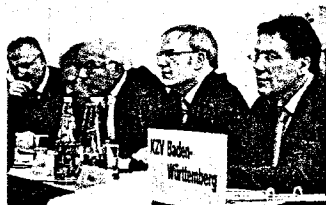
Vertreterver- sammlung der KZBV Starke Region, neue Partner- schaft

Kompetente Zugkraft aus Baden-Württemberg Kontinuität mit klarer Programmatik