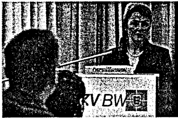
Vertreterversammlung der KZV BW Klare Kante