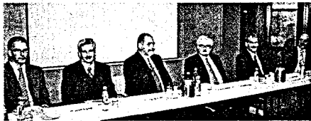
Vertreterversammlung der Bezirkszahnärztekammer Karlsruhe „Berufsstand muss Wandel aktiv gestalten“