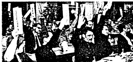
Vertreterversammlung der BZK Stuttgart Guter Start in die neue Legislaturperiode