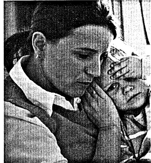
Evidenzbasierte Daten zu Phytopharmaka bei Kindern sind rar. Die Kooperation Phytopharmaka versucht, diese Lücke zu schließen. Seite 24