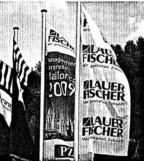
Bei der Vergütung von Dienstleistungen streben die Berufsorganisationen Verträge mit den Krankenkassen an. Seite 6