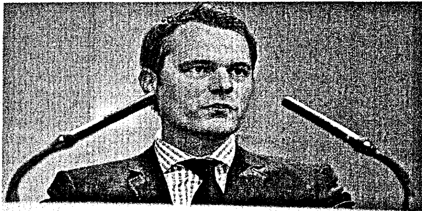
Der Parlamentarische Staatssekretär im BMG, Daniel Bahr, während seiner Eröffnungsansprache beim 32. Deutschen Krankenhaustag am 18. November 2009 in Düsseldorf.