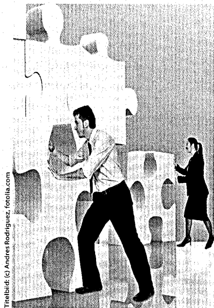
Titelbild: © Andres Rodriguez, fotolia.com