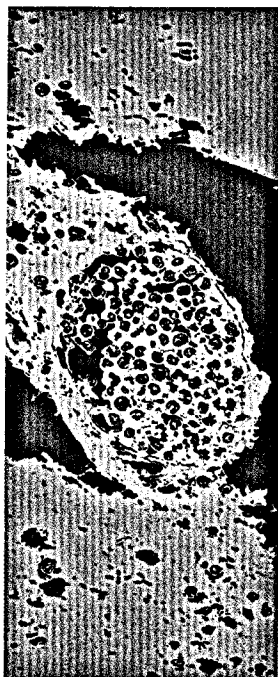
Titelbildvorlage: Leukostase in einem Hirn- gefäß bei Hyperleukozytose (Seite 1882)