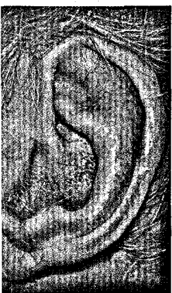
Fotografie des linken Ohres mit äußerliche Auffälligkeiten (Seite 1870).