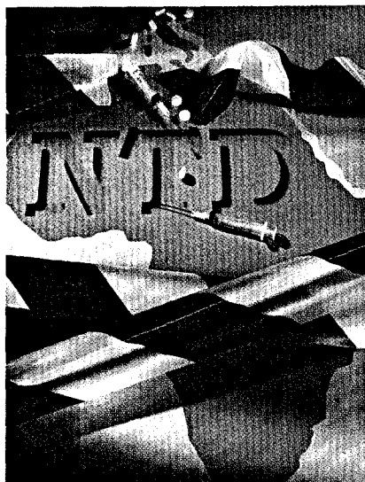
Mithilfe eines globalen Aktionsplans will die WHO die sogenannten vernachlässigten Krankheiten bekämpfen. Seite 18