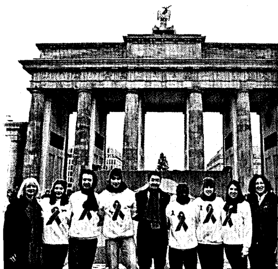
Deutschland zeigte Schleife beim Welt-Aids-Tag, an dem es auch darum ging, auf die soziale Isolation vieler Betroffener hinzuweisen. Seite 6