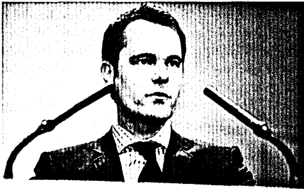
Der Parlamentarische Staatssekretär im BMG, Daniel Bahr, während seiner Eröffnungsansprache beim 32. Deutschen Krankenhaustag am 18. November 2009 in Düsseldorf.