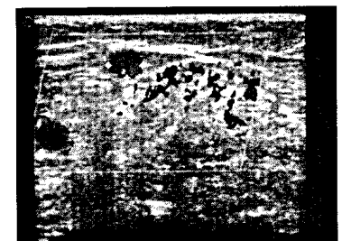
Behandlung der Varikose Seite 637