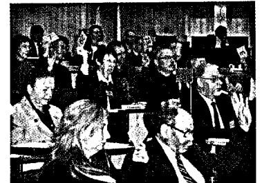
41. Kammerversammlung Seite 609