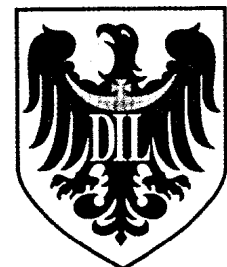
20 Jahre Niederschlesische Ärztekammer Seite 623