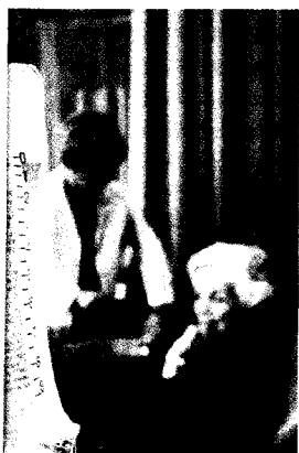
Versorgung zuhause bei älteren Patienten.