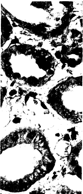
Titelbildvorlage: Sonographie-gesteuerte Nierenbiopsie (s. DMW Falldatenbank S. 2231).