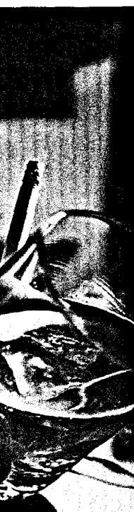
Titelbildvorlage: Symbolbild.

Das Supplement „Abstractband zum 3. Nationalen Präventionskongress“ ist online unter www.thieme-connect.de verfügbar.