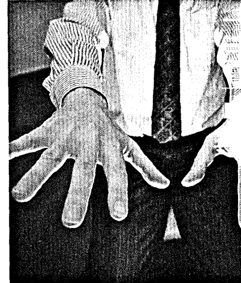
Der erste Preis der Förderinitiative Pharmazeutische Betreuung ging an eine Arbeit, die sich den Besonderheiten bei Parkinson widmet. Seite 30