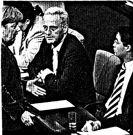
Auf die Bundesregierung wartet noch ein gutes Stück Arbeit, bis alle Konfliktpunkte in der Gesundheitspolitik entschärft sind. Seite 6