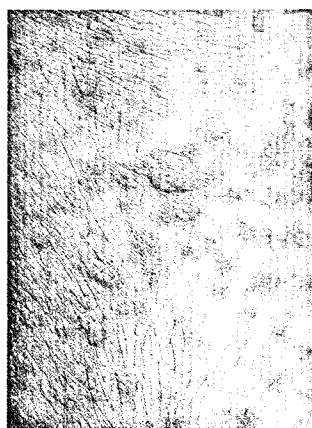
Toxisch epidermale Nekrolyse (S. 437).