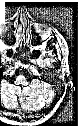
Initiales cMRT kurz nach Aufnahme. Zu sehen sind hyperdense Läsionen links zerebellär.