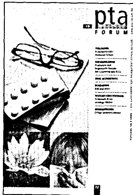
In dieser Ausgabe finden Sie das Supplement PTA-Forum 10/2009.