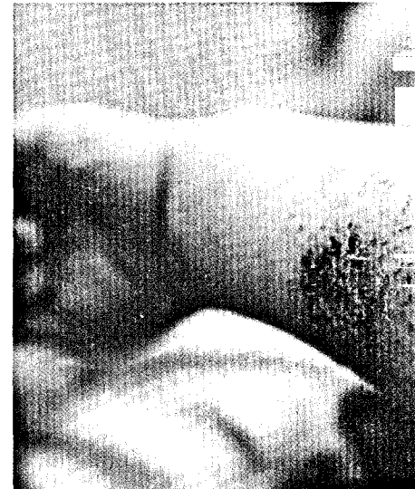
Mit Vitamin B 12 und Avocado-Öl gegen chronische Hauterkrankungen wie Neurodermitis. Evidenzbasiert oder Medienhype? Seite 26