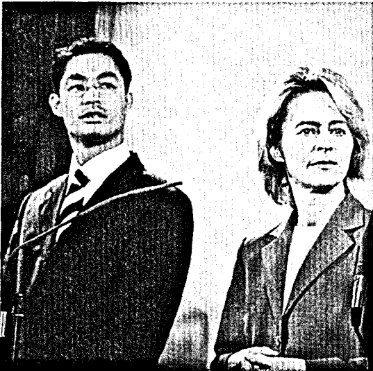
Philipp Rösler und Ursula von der Leyen präsentierten die umstrittenen Vereinbarungen der Koalition zur GKV-Finanzierung. Seite 6