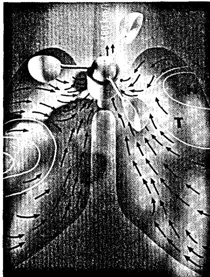
Husten ist ein wichtiger Schutzmechanismus und gleichzeitig eines der häufigsten Krankheitssymptome. Seite 18