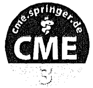
Bild und Fall Photo essay