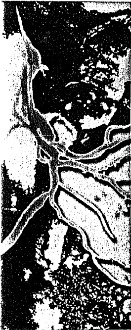
Titelbildvorlage: Angiografie (Seite 1809)