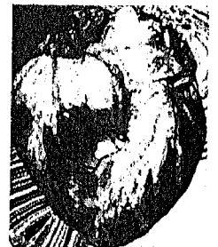
28_Thema: Epikardiales Fettgewebe