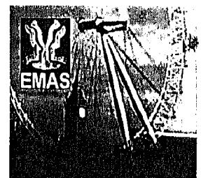
33_Berichte vom 8. Europäischen Menopausekongress (EMAS)