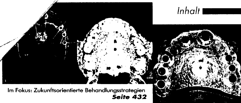
Im Fokus: Zukunftsorientierte Behandlungsstrategien Seite 432