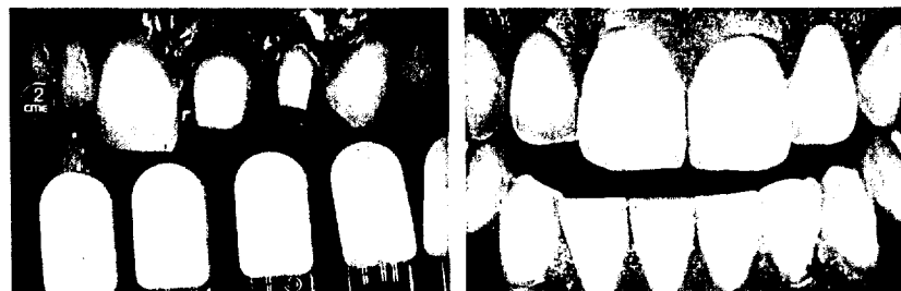
Die Farbauswahl in der Praxis Natürlich restaurierte Zähne – Eine Herausforderung