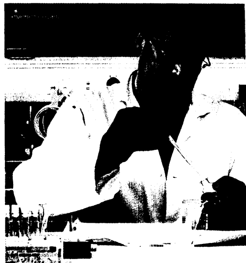
Mit Liraglutid und Histrelin haben Forscher weitere neue Wirkstoffe entwickelt. Im Juli kamen beide Substanzen auf den Markt. Seite 24