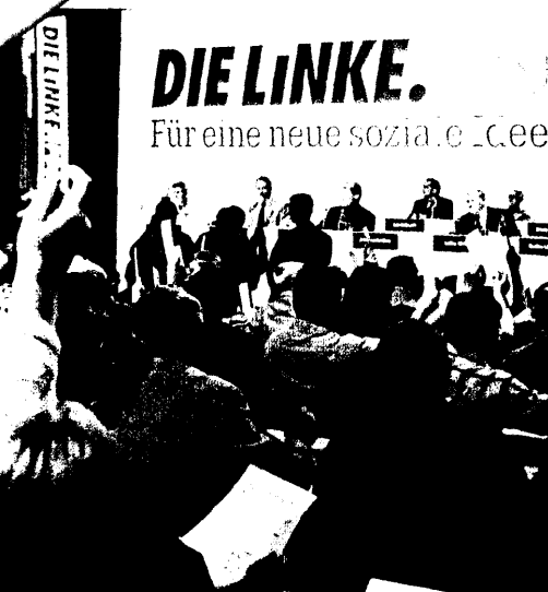
Die Linke: Gesundheitspolitisch für die inhabergeführte Apotheke – steuerpolitisch eher nicht. Seite 6