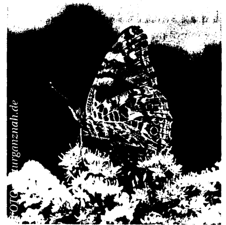
Titelfoto: Distelfalter auf Goldrute (Solidaginis virg. herb.)