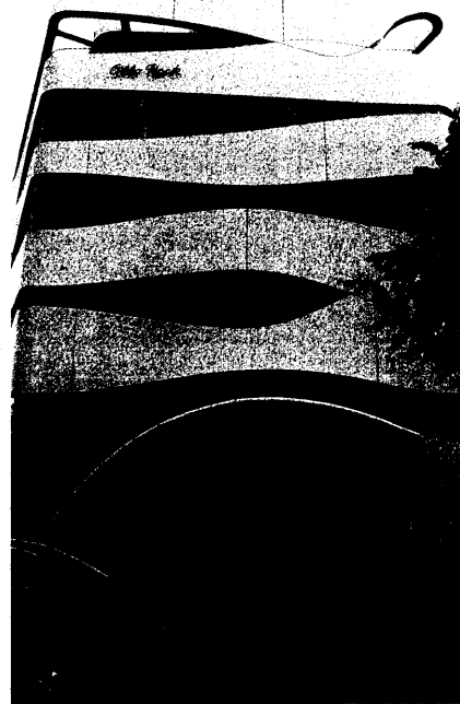
Muskelfasern nachempfunden ist die Fassade des in Berlin neu eröffneten Science Center Medizintechnik.

Science Center Medizintechnik gibt faszinierende Einblicke 28