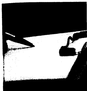
Bereits Studenten werden von kleinen Werbeartikeln der Pharmafirmen beeinflusst.

C. Lübbert, C. Taege, T. Seufferlein, R. Grunow