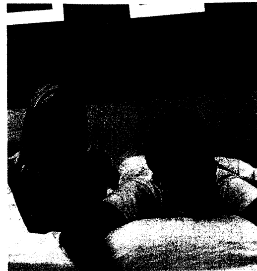
Erstmals ist für Männer, die unter vorzeitiger Ejakulation leiden, mit Dapoxetin eine Behandlungsoption auf dem Markt. Seite 28