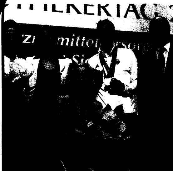
Die Apotheker werden ihre Zusammenarbeit mit dem Deutschen Behindertensportverband in den kommenden Jahren fortsetzen. Seite 10