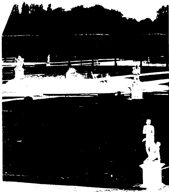
Basis- und/oder Luxusversorgung – welchen Weg geht die Zahnmedizin? Ein Bericht von der DGZ-Jahrestagung in Hannover Ab Seite 126