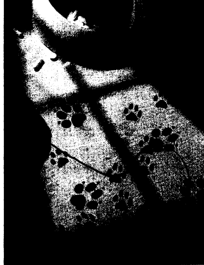
Möglichkeiten und Grenzen der Beratung bei Tierkrankheiten. Seite 16