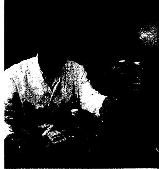
Diabetesversorgung in der Apotheke: Intensivierte Betreuung erhöht die Qualität der Blutzuckerselbstkontrolle. Seite 26