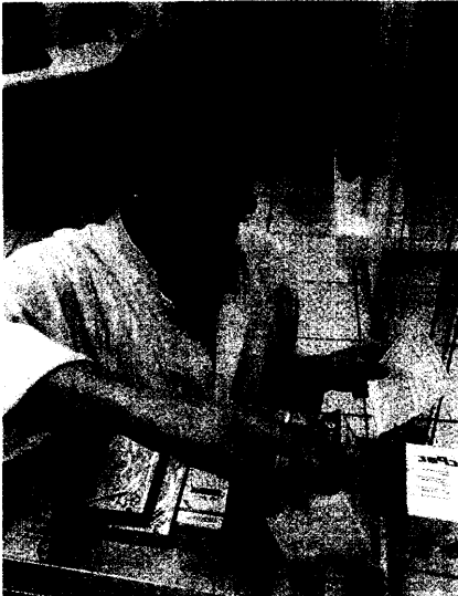
Anfang nächster Woche starten die neuen Rabattverträge der AOK. Seite 6