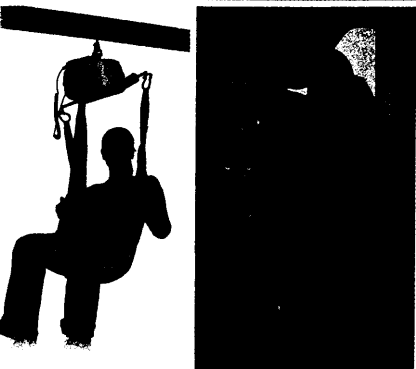
Wie in jeder Ausgabe: Auf unseren Produktseiten finden Sie Neues zur Verbesserung der Lebensqualität als auch Innovatives für Therapie und Pflege.