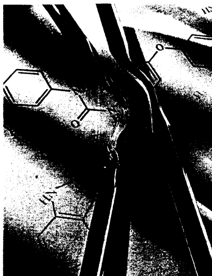
Mit Bevacizumab wurde 2005 erstmals ein Hemmstoff der Angiogenese zugelassen. Seite 18