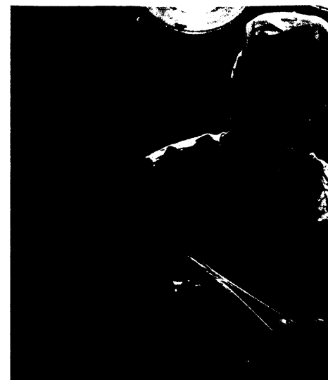
Steht Patienten mit chronischer Erkrankung wie Asthma oder Diabetes eine OP bevor, gilt es einiges zu beachten. Seite 26