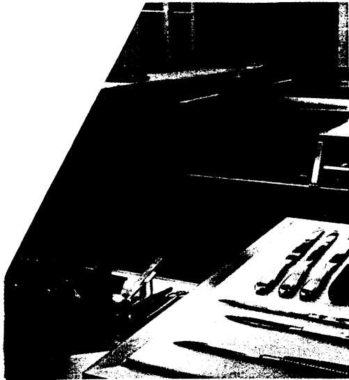
Patientensicherheit: Etwa 17 500 Todesfälle jährlich gehen in Deutschland auf Behandlungsfehler zurück. Seite 34