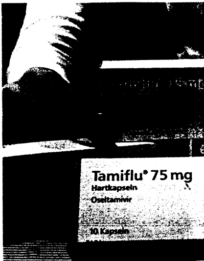
Auch dank der Vogelgrippe ist die Bundesrepublik für eine mögliche Grippepandemie gut aufgestellt ist. Seite 6