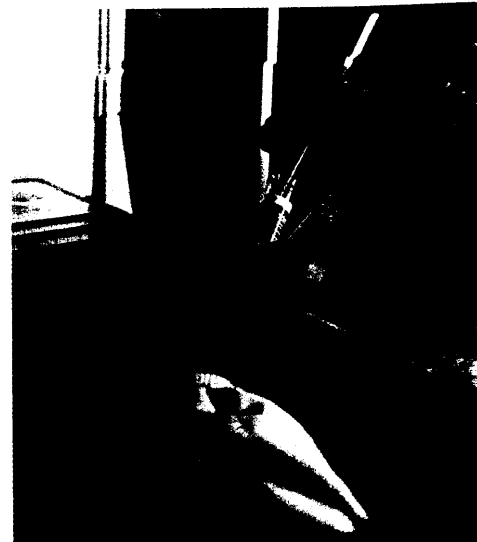
Der Biopharmazeutika-Markt boomt: Unter anderem arbeiten Forscher an einer neuen Generation von Antikörpern. Seite 24