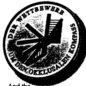
And the winner is ... Seite 180