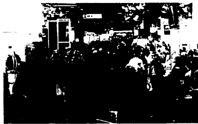
IDS - Ein Paradebeispiel Seite 152