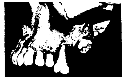
Symposium Dentale Morphologie Seite 174