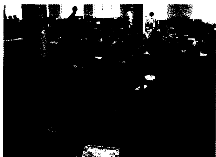
Die Geister, die ich rief ...: Tuttlingen II in Pakistan.

Studie belegt Erfolg des Home-Monitoring für ICD-Patienten 92