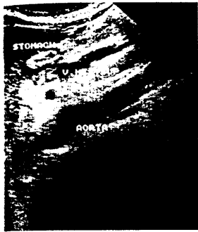
Oberbauchsonographie bei funktioneller Dyspepsie.