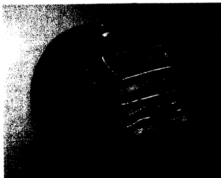
In der Rehabilitation nach einem Mammakarzinom können Patientinnen Koordination und Stabilisation der oberen Extremitäten beispielsweise am Balancekreisel trainieren Seite 261