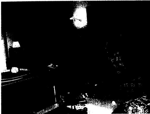
Kinder-Kochworkshop zur Prävention von Ess-Störungen.