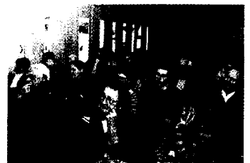
Ärztebiografien im Nationalsozialismus Seite 114