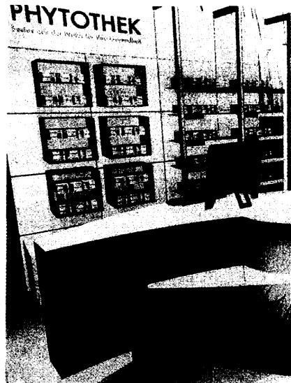
Bionorica präsentiert auf seiner Bilanzpressekonferenz beneidenswerte Zahlen. Seite 35