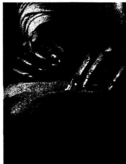
Ein neuer Studiengang verbindet kommunikations- und kulturwissenschaftliche Aspekte mit komplementärmedizinischen Inhalten. Seite 50