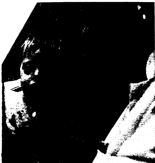
Die medizinische Versorgung von behinderten Menschen weist in Deutschland immer noch Defizite auf. Seite 32