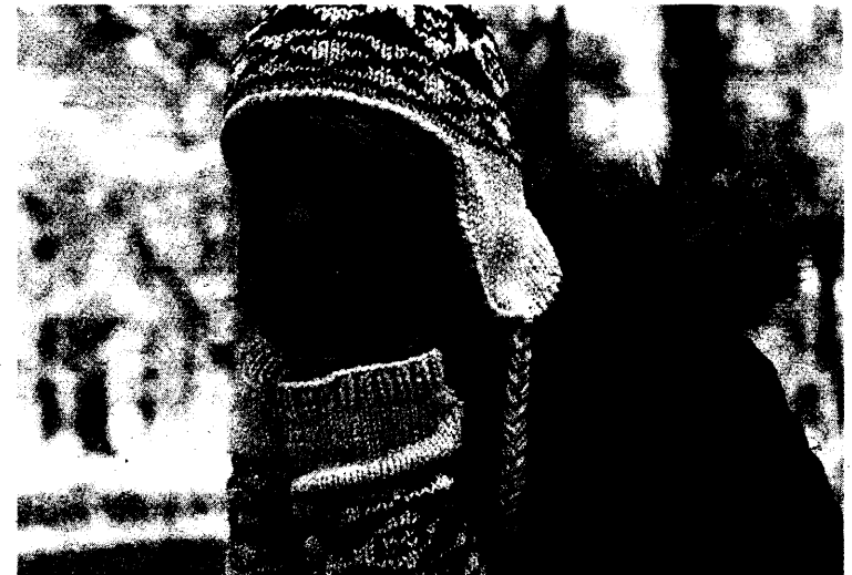
Biathletin mit Einsatz: Magdalena Neuner.

nehmende Hausärzte in Bayern nach Angaben des BHÄV künftig einen durchschnittlichen Fallwert von etwa 85 Euro erhalten. Die Vergütung setzt sich im Wesentlichen zusammen aus einer kontaktunabhängigen Strukturpauschale in Höhe von 21,25 Euro, einer Behandlungspauschale von 50 Euro und einem Zuschlag für chronisch Kranke in Höhe von 26 Euro. Einzelne Anlagen des Vertrags mit technischen Details sol-