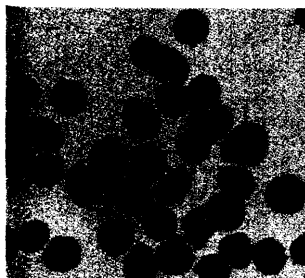
Blutausstrich: P. falciparum .