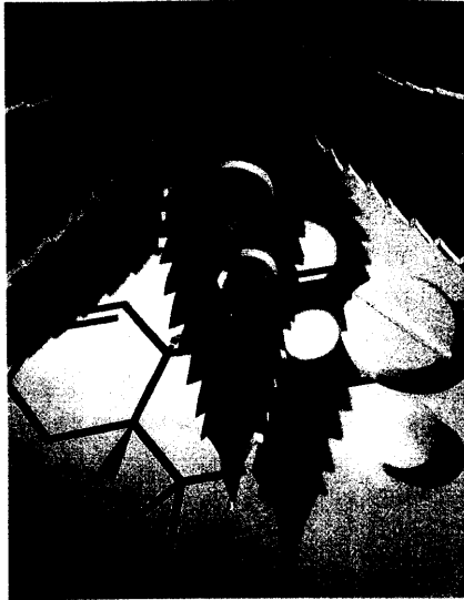
In Deutschland kommt Dronabinol nur als Rezeptursubstanz in DAC-Qualität zum Einsatz. Seite 16