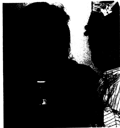
Off-Label-Use: Häufig fehlen in den Fachinformationen altersgerechte Angaben für Kinder. Seite 24