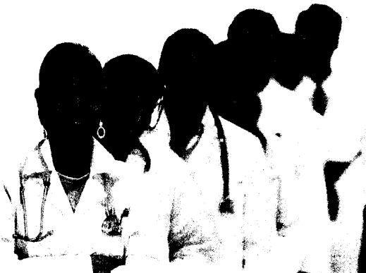
Start des bundesweiten Projektes: Evaluation der Weiterbildung.